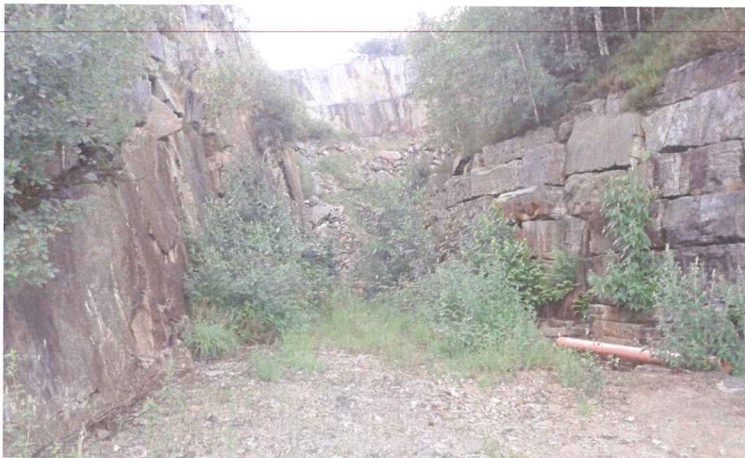
Illustrazione 5: la "trincea" di collegamento con l'attività estrattiva posta a est