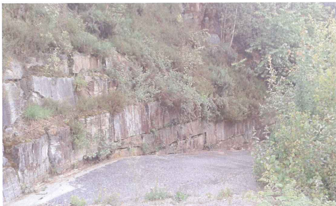
Illustrazione 4: la parte est della porzione in stima con il muro di sostegno