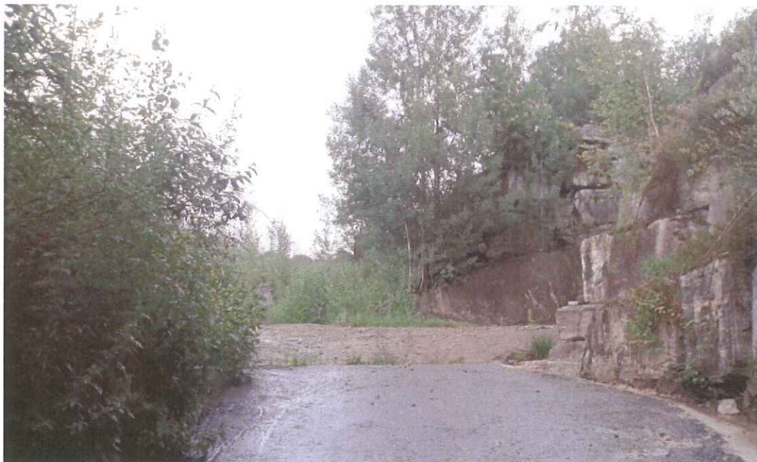
Illustrazione 2: l'arrivo della strada sul piazzale