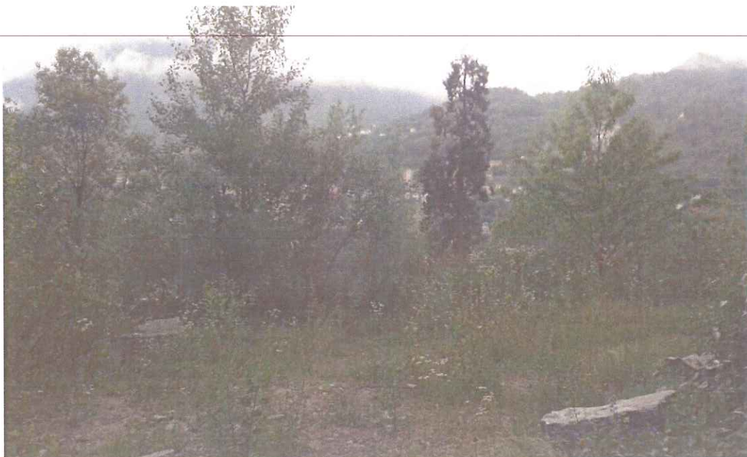
Illustrazione 3: il piazzale inerbito