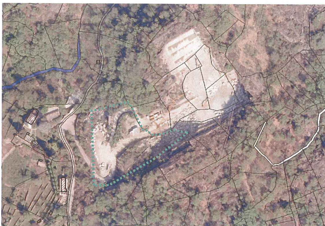
Illustrazione 6: foto aerea